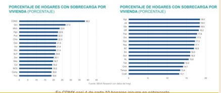
El 20.1% de los hogares que pagan por su vivienda tienen sobre gasto

La situación se hace más evidente cuando se divide por nivel de ingresos y por aquellos que están afiliadas al Instituto del Fondo Nacional de la Vivienda para los Trabajadores (Infonavit). La población de menores recursos que tiene Infonavit destina 32.9 por ciento de sus ingresos al pago de la vivienda, mientras que para los trabajadores de mayor poder adquisitivo la proporción es de 8.8 por ciento. No obstante, las familias más vulnerables que no están afiliadas al organismo destinan 49.4 por ciento de sus recursos al pago de una hipoteca o de su renta, y los de alto poder adquisitivo hasta 35.3 por ciento. (...) VER MAS